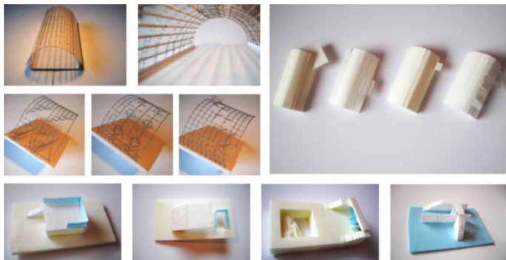
1 pav. Modeliai: galimybių studija

Vykdamant studentų miestelio plėtros projektą, svarstoma kaip pagerinti studijų infrastruktūrą universitete. Vienu iš didžiausių iššūkių tampa pakankamas grupinio darbo vietų sukūrimas, kadangi šis mokymosi metodas tampa vis svarbesnis studijų procese. Kol kas universitete nėra grupinio darbo paskirties patalpos koncepcijos. Šiam tikslui įgyvendinti bus rekonstruojamas anгарas. Atsižvelgiant į tai, kad pagrindiniai statinio vartotojai bus technikos universiteto studentai, dėmesys sutelkiamas į brangstančios energijos ir didėjančių jos vartojimo sąnaudų problematiką. Projektu siekiama atkreipti dėmesį į galimus projektavimo sprendimus įgyvendinant novatoriškus metodus, tobulinant konstrukcijų charakteristikas bei erdvinio modeliavimo sąveiką tvarioje architektūroje [1]. Tokiu būdu parodyti pastato bei energijos ryšio svarbą, kas turėtų būti laikoma vertingomis žiniomis kiekvienam technikos universiteto studentui. Remiantis tuo, yra poreikis taikyti atitinkamus architektūrinius bei inžinerinius sprendimus kuriant energiją taupančią pastatą.